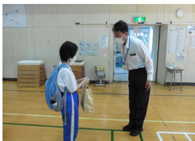
手作りキャンドルを浦戸小中の校長先生へ