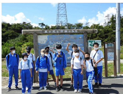
野々島に上陸し、記念写真