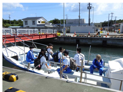
渡し船で寒風沢から野々島へ