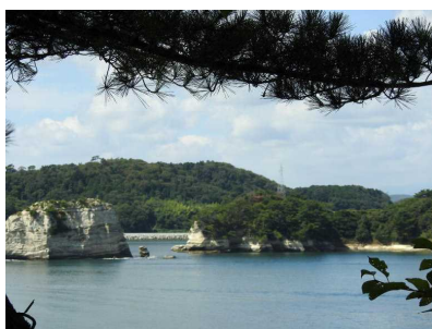
寒風沢、砲台跡からの景色

9月15日(水)、青雲学級・潮風学級の生徒10名が浦戸諸島の寒風沢、野々島で校外学習に行ってきました。当日は天気にも恵まれ、移動のバスや市営汽船の中では和気あいあい。和やかな雰囲気での学習が始まりました。島では虫取りや木の実拾いなど自然に親しみながら史跡を巡り、最後は釣りを体験しました。あまり知られていない「ふるさとの歴史」や自然に触れたことも成果ですが、学級の絆が深まったことが一番の収穫でした。