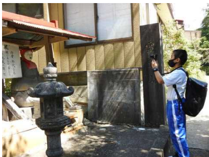
化粧地藏の記録写真を撮影